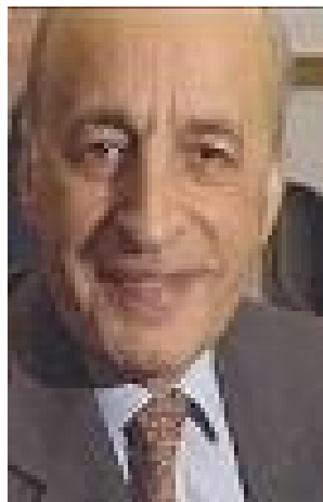
سر داوود آلیانس