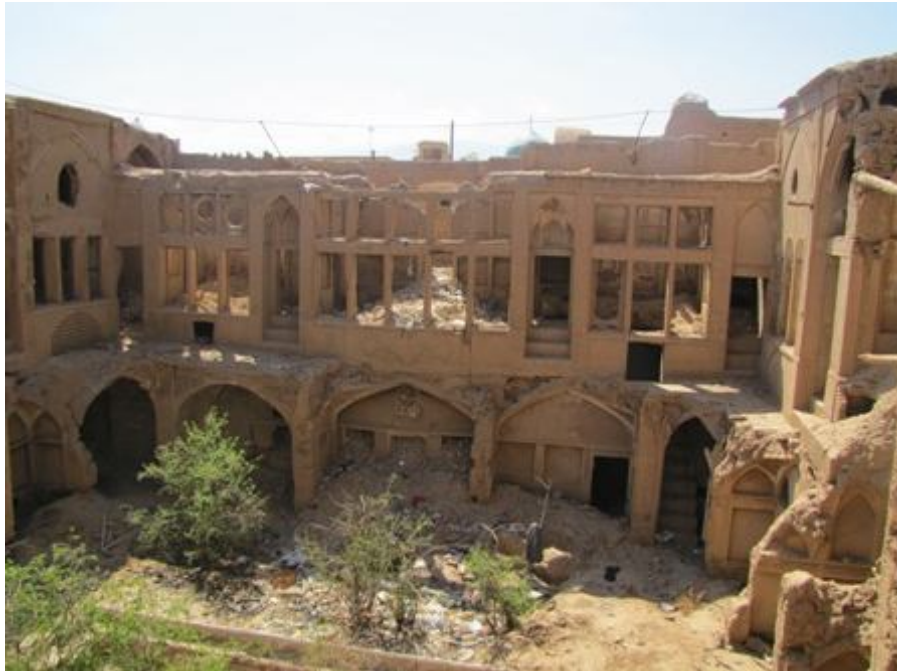
منزل مخروبه در محله یهودیان در منطقه درب گلدان کاشان