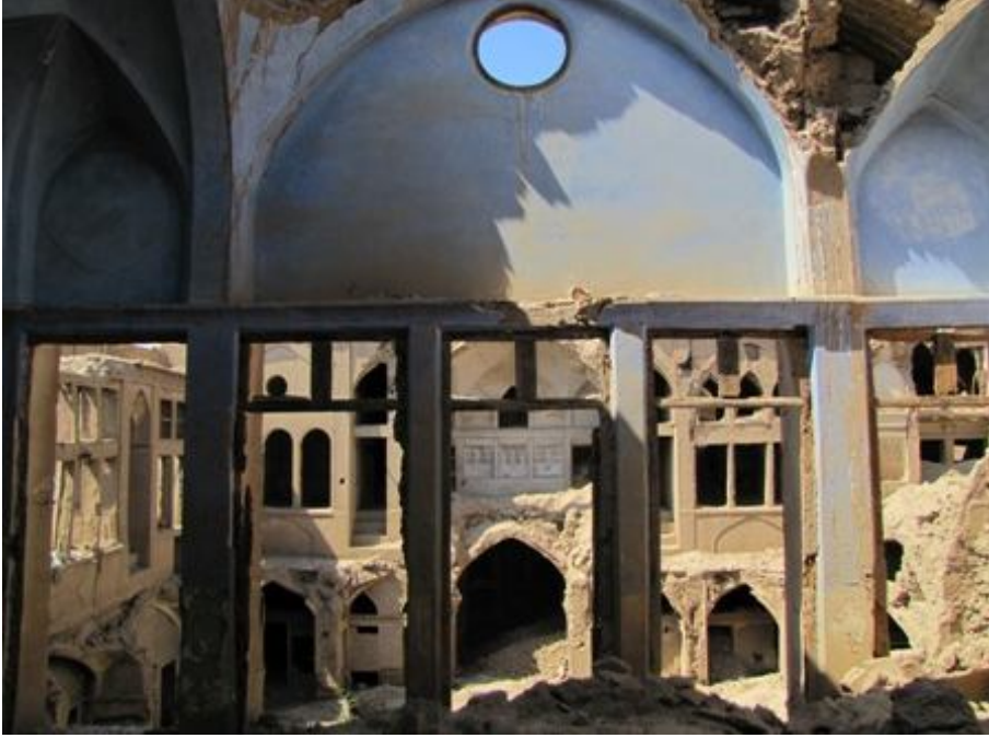
وضعیت جامعه یهودیان کاشان در دوران پهلوی و ماجرای قتل دکتر برجیس