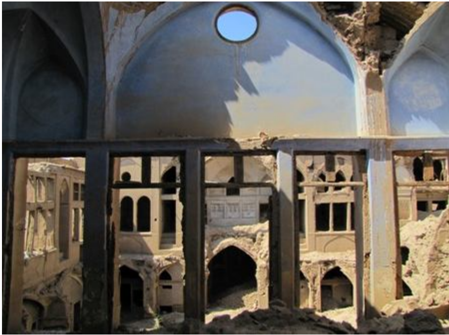
وضعیت جامعه یهودیان کاشان در دوران پهلوی و ماجرای قتل دکتر برجیس