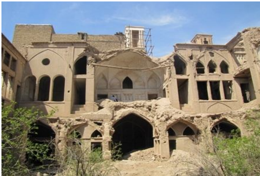
منزل مخروبه در محله یهودیان در منطقه درب گلدان کاشان