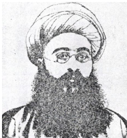
تصویر موبد بیدگلی که در کتاب شرح حال رجال ایران در قرن 12 و 13 و 14 هجری نوشتهٔ مهدی بامداد آمده است.

عکس‌ها در دوران قاجار و توسط آنتوان سوریوگین (1840-1933م) برداشته شده‌اند. از آنجا که او بیشترین سال‌های عمر خویش را در دوران حکومت قاجارها بر ایران سپری کرده، به عکاس عصر قاجاریه معروف است. (به نقل از http://20ist.com/archives/638 ) آنتوان خان سوریوگین (A. Sevruguin)، عکاس مشهور گرجی بوده که در حدود دههٔ آخر سدهٔ سیزدهم هجری، از قفقاز به تبریز آمده و عکاسخانهٔ خود را در آن شهر دایر کرده و سپس بر اثر موفقیتی که به دست آورده بود، به دربخانهٔ مظفرالدین میرزا راه یافته، جزو عکاسان سرکاری شد... گویا وی همراه مظفرالدین شاه یا کمی پیش از او رهسپار تهران شده، در این شهر در خیابان علاءالدوله (فردوسی) جنب در شرقی میدان مشق، عکاسخانهٔ خود را دایر ساخت و در اندک زمانی، شهرت و معروفیتی در میان مردم تهران به دست آورد... وی مجموعه‌ای بزرگ و گرانها از شیشه‌های عکس‌های قدیمی ایران فراهم آورده بود که بر اثر پیشامد و بلوایی همهٔ آن‌ها شکسته از میان رفت ... آنتوان سوریوگین در شیشه و متن این عکس‌ها، اغلب شماره‌گذاری کرده و در برخی از آن‌ها دستینهٔ خود را به روسی نهاده است (ر.ک: تاریخ عکاسی و عکاسان پیشگام در ایران، ص 136 تا 141) عکس بالا با عنوان «زننده به گور» ثبت شده است و در گوشهٔ پایین سمت راست این تصویر، شماره‌ای که خود آنتوان خان نوشته، همچنان دیده می‌شود.