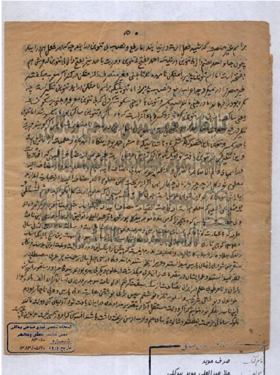
تصویر صفحه پایانی نسخه کتاب صرف موبد