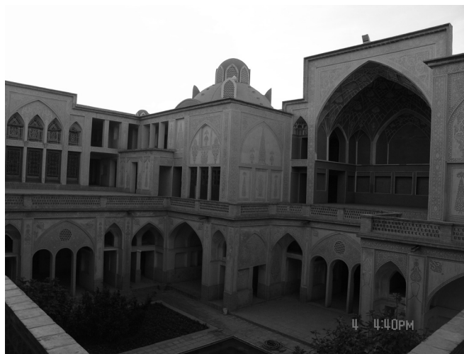
شکل شماره ۶

شکل شماره (۵) در خانه عباسیان در زیرزمین تقریباً همه قسمت‌ها به یکدیگر مرتبط بوده است. همان‌طور که در تصویر مشاهده می‌شود از درون ایوان، جبهه جنوبی حیاط دوم و ایوان جبهه شمالی پیداست. این امر باعث می‌شود میکرو اقلیمی خاص در درون فضای خانه شکل بگیرد.