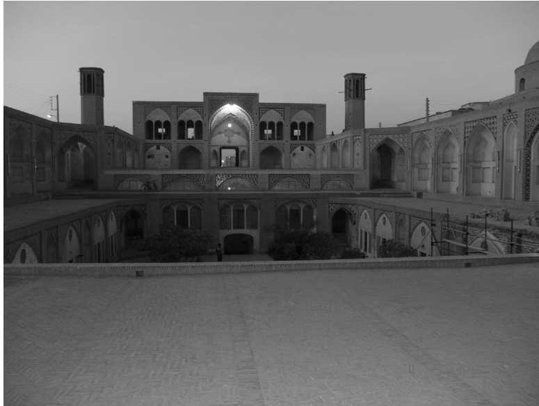
شکل شماره ۹

در شکل شماره (۹) نمای شمالی مسجد و مدرسه آقا بزرگ که دو بادگیر در دو سمت آن باد را برای خنک‌سازی به زیر زمین و سرداب انتقال داده و موجب خنک سازی محیط می‌گردد.