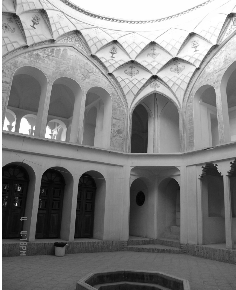
شکل شماره ۱۶

شکل‌های (۱۵ و ۱۶) حیاط خلوت پشت جبهه جنوبی خانه طباطبائی‌ها و اطاق‌های اطراف که برای استفاده تابستانی بوده است.