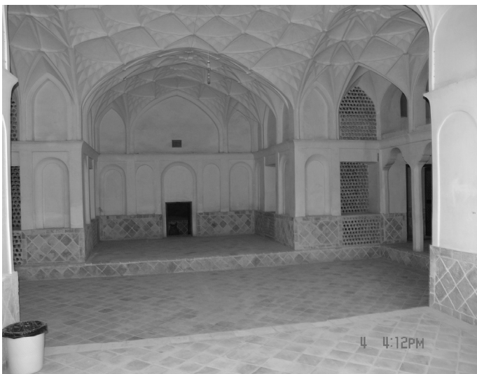
شکل شماره ۱۱

شکل‌های (۱۰ و ۱۱) ورودی و فضای داخل زیرزمین خانه طباطبائی‌ها است.