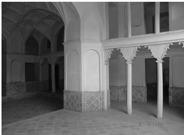
شکل شماره ۱۷