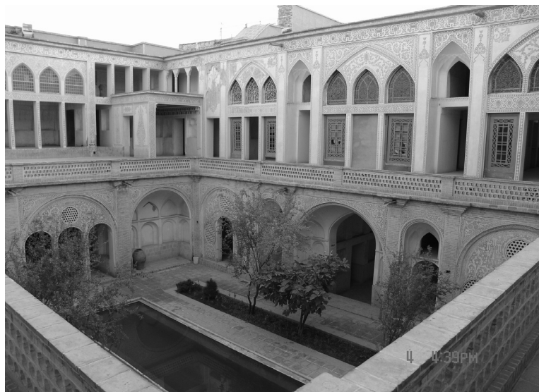
شکل شماره ۴

شکل شماره (۳) برش عمودی نقشه خانه عباسیان که از امتداد طولی خانه برداشت شده است. طبقه زیرین که به صورت گودال باغچه از سطح عمومی کوچه پایین تر است کاملاً در تصویر مشخص است (منبع: گنجنامه ۱۳۷۵: ۱۲۶).