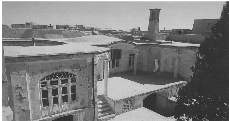
شکل شماره ۱۸

گرم: مهتابی به فضایی در یکی از چهار سمت خانه اطلاق می‌شود که بصورت ایوان بدون سقف بوده و چند پله از کف حیاط بلندتر است و از سه طرف با دیوارهای اطراف محصور و از طرف چهارم به حیاط باز می‌شده و دید داشته است. وجه تسمیه آن نیز احتمالاً به علت استفاده از نور ماه در شب بوده است. در کتاب گنجنامه در تعریف مهتابی آمده است: «مهتابی فضای بدون سقفی است که بالاتر از سطح حیاط قرار می‌گیرد، دیوارهای این فضا نماسازی می‌شود و به همین ترتیب به ایوانی شباهت پیدا می‌کند که سقف آنرا برداشته اند، این فضا معمولاً از سه طرف بسته و از طرف چهارم به فضای باز مشرف است (گنجنامه، ۱۳۷۹: ۶).