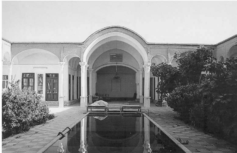
شکل شماره ۱۳

شکل شماره (۱۳) ایوان جبهه جنوبی و حوضخانه در میانه آن در خانه اصفهانی‌ها (منبع: گنجنامه ۱۳۷۵: ۲۱)