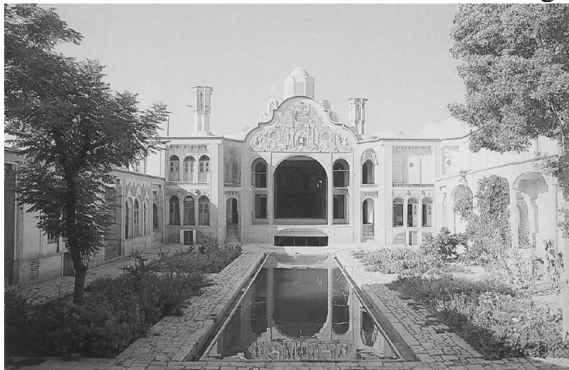
شکل شماره (۱) جبهه شمالی خانه بروجردی‌ها، استفاده از حیاط مرکزی برای تهیه ریززیست‌اقلیم خاص و نیز استفاده از جریان باد بادگیرها برای خنک سازی محیط حیاط که دریچه‌های آن در دو گوشه جبهه شمالی بر روی سطح زمین مشاهده می‌شود.

باز، قابل تحمل سازد (شکل شماره ۱). ساخت خانه در اطراف حیاط مرکزی باعث می‌شود تا علاوه بر اینکه از ورود بادهای گرم تابستانه و یا بادهای همراه با گرد و خاک به داخل اتاق‌ها و محیط خانه جلوگیری نماید، دیوارهای چهار جبهه و به خصوص جبهه جنوبی که از سایر دیوارها بلندتر می‌باشد، باعث سایه اندازی در حیاط می‌شود و محیط خنکی را در فصل گرم ایجاد نماید. همچنین وجود دیوارهای بلند در اطراف حیاط، موجب می‌شود خانه از گزند بادهای سرد و وسوزان زمستانی در امان بوده و حفاظت شود تا زیست‌اقلیم درونی محیط خانه و اتاق‌های اطراف، هوایی گرم‌تر و مطبوع‌تر داشته باشند.