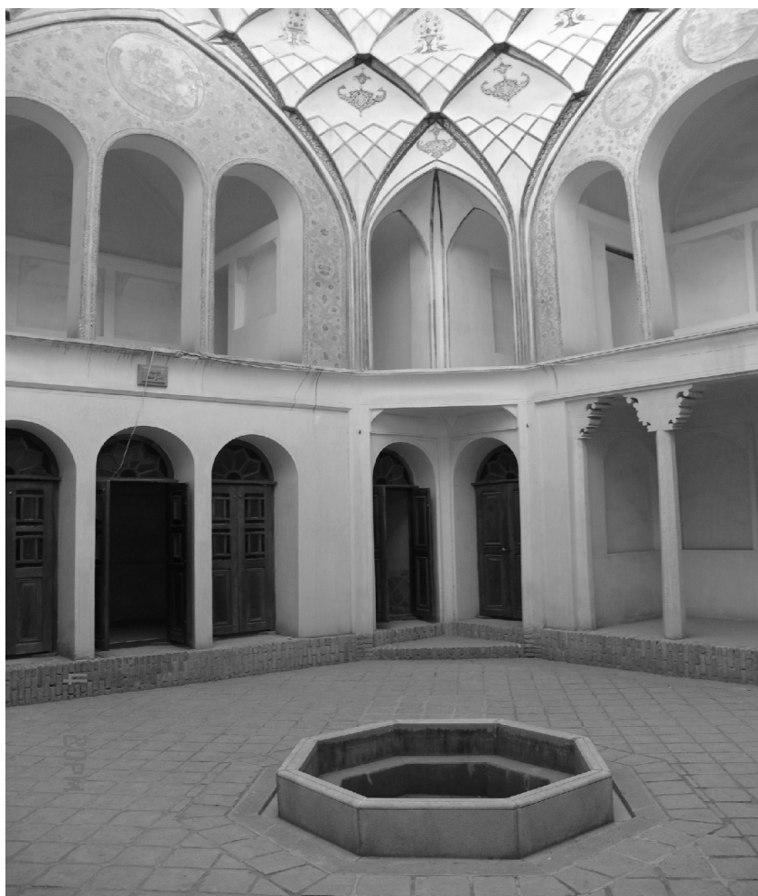
شکل شماره ۱۵

۸ - استفاده از هشتی در بدو ورود به خانه: هشتی، فضایی است که عموماً هشت ضلعی بوده و بلافاصله بعد از در ورودی قرار داشت و دارای دو در است که یکی از آنها به کوچه و دیگری به دالان پریچ وخم و شیب‌دار منتهی به حیاط مرکزی باز می‌شود. در داخل هشتی که به اشکال مربع، هشت و نیم، هشت و ... نیز بوده است، اجزائی مانند سگّو، چراغدان و ... قرار دارد و معمولاً در سقف آن از نورگیر برای تأمین روشنایی استفاده می‌شود. هشتی‌ها را نسبت به کف کوچه، گودتر می‌ساخته‌اند تا کوران هوای گرم یا سرد وارد نشود.