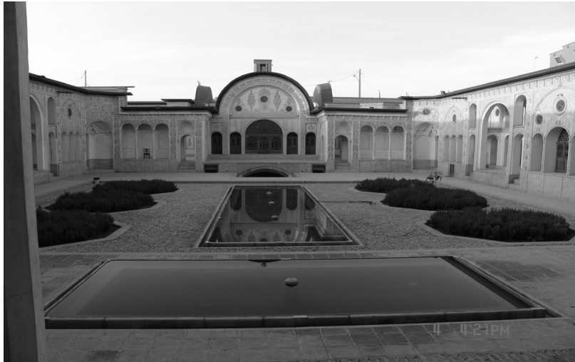
شکل شماره ۱۴

شکل شماره (۱۴) جبهه شمالی خانه طباطبائی‌ها و استفاده از آب برای خنک‌سازی محیط حیاط