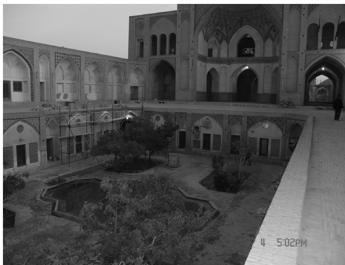
شکل شماره ۷

در شکل شماره (۷) زیر زمین مسجد و مدرسه آقا بزرگ را که به صورت گودال باغچه ساخته شده است نشان می دهد.