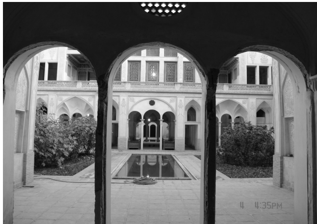
شکل شماره ۵

شکل شماره (۵) در خانه عباسیان در زیرزمین تقریباً همه قسمت‌ها به یکدیگر مرتبط بوده است. همان‌طور که در تصویر مشاهده می‌شود از درون ایوان، جبهه جنوبی حیاط دوم و ایوان جبهه شمالی پیداست. این امر باعث می‌شود میکرو اقلیمی خاص در درون فضای خانه شکل بگیرد.