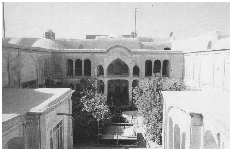
شکل شماره ۱۲

۴- استفاده از ایوان و فضای باز در جبهه جنوبی: در اغلب خانه‌های کاشان جبهه جنوبی دارای ایوانی مسقف و بزرگ بوده که معمولاً بدون هیچ‌گونه پنجره‌ای به حیاط مرکزی راه دارد. از این ایوان برای استراحت و نشستن در بعدازظهرها و شبهای تابستان استفاده می‌شده است. همان‌طور که ذکر شد بیش از سه ماه از سال (خرداد، تیر و مرداد) شرایط آسایش شبانه، آن هم در سردترین ساعات شبانه‌روز برقرار است و متوسط دما حداقل، مربوط به ساعت شش صبح به وقت محلی است. بنابراین در ساعات بعدازظهر، غروب و اوایل شب در اوقات بیشتری از سال شرایط آسایش در فضای باز برقرار است. بر اساس اظهارات محلی از اواسط بهار تا اواسط پاییز می‌توان در شب از فضای آزاد بهره برد. بنابراین اهمیت نقش ایوان، آن هم در جبهه جنوبی برای استراحت کاملاً مشخص است. در وسط ایوان، حوض آبی قرار دارد که برای تلطیف هوای گرم و خشک کاشان ضروری است. همچنین در دو سمت ایوان، اتاق‌هایی احتمالاً برای استراحت در اوقات خنک‌تر شب وجود دارد (اشکال شماره ۱۲ و ۱۳).