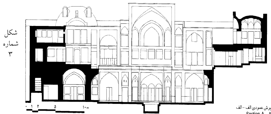
شکل شماره ۳

شکل شماره (۳) برش عمودی نقشه خانه عباسیان که از امتداد طولی خانه برداشت شده است. طبقه زیرین که به صورت گودال باغچه از سطح عمومی کوچه پایین تر است کاملاً در تصویر مشخص است (منبع: گنجنامه ۱۳۷۵: ۱۲۶).