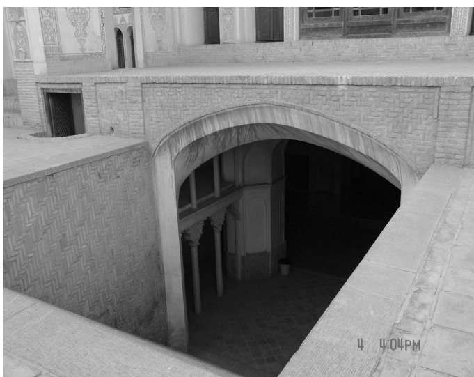
شکل شماره ۱۰

زیرزمین مسجد ساخته شده، به شکل جالبی مورد استفاده طلاب - هم در فصل گرم و هم در فصل سرد سال - بوده است. شکل‌های شماره (۷) تا (۹) این مطلب را به خوبی نشان می‌دهد.