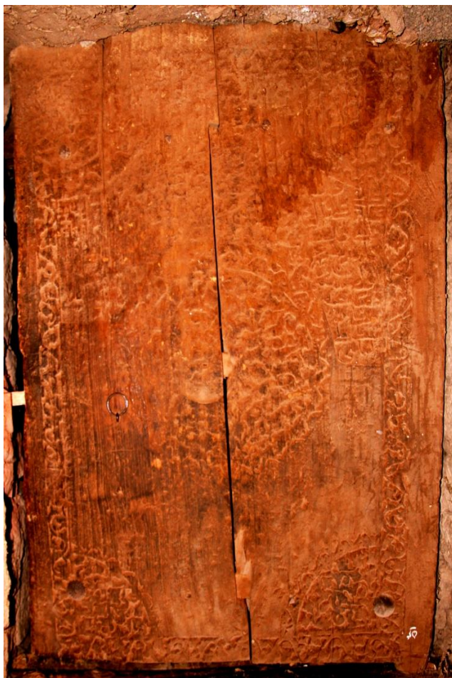
نگاره 14: در خانه حبیبی (970 ق)

نقوش گل بوته اسلیمی برجسته‌کاری شده است و تمام نیمه بالایی در کتیبه‌کاری شده است. عمده کتیبه‌ها محو شده و قابل خواندن نیست. با این اوصاف می‌توان فهمید حدود سال 970 هجری است. بخش‌هایی از کتیبه که در سمت راست قرار دارد، این است: «... تاریخ شهر... سبعین و تسعمائة... صاحبه محمدعلی بن سلطان علی ابیانه‌ای» در جانبین کتیبه‌ها نیز دو قفل علی به چشم می‌خورد. (نگاره 14)