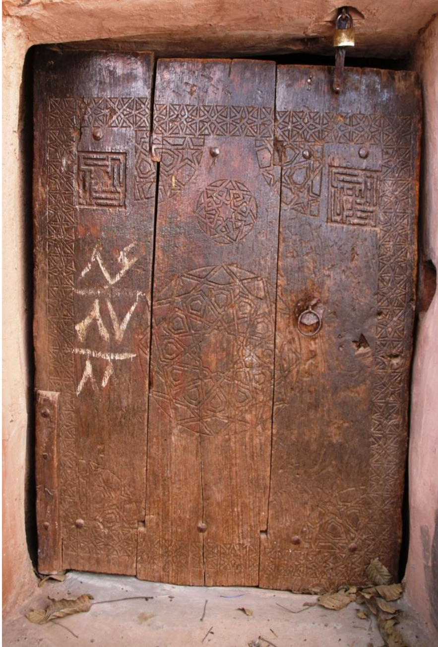
نگاره 20: در خانه بیان فر

پژوهش نامه کاشان شماره سوم (پایه 11) پاییز و زمستان 1392