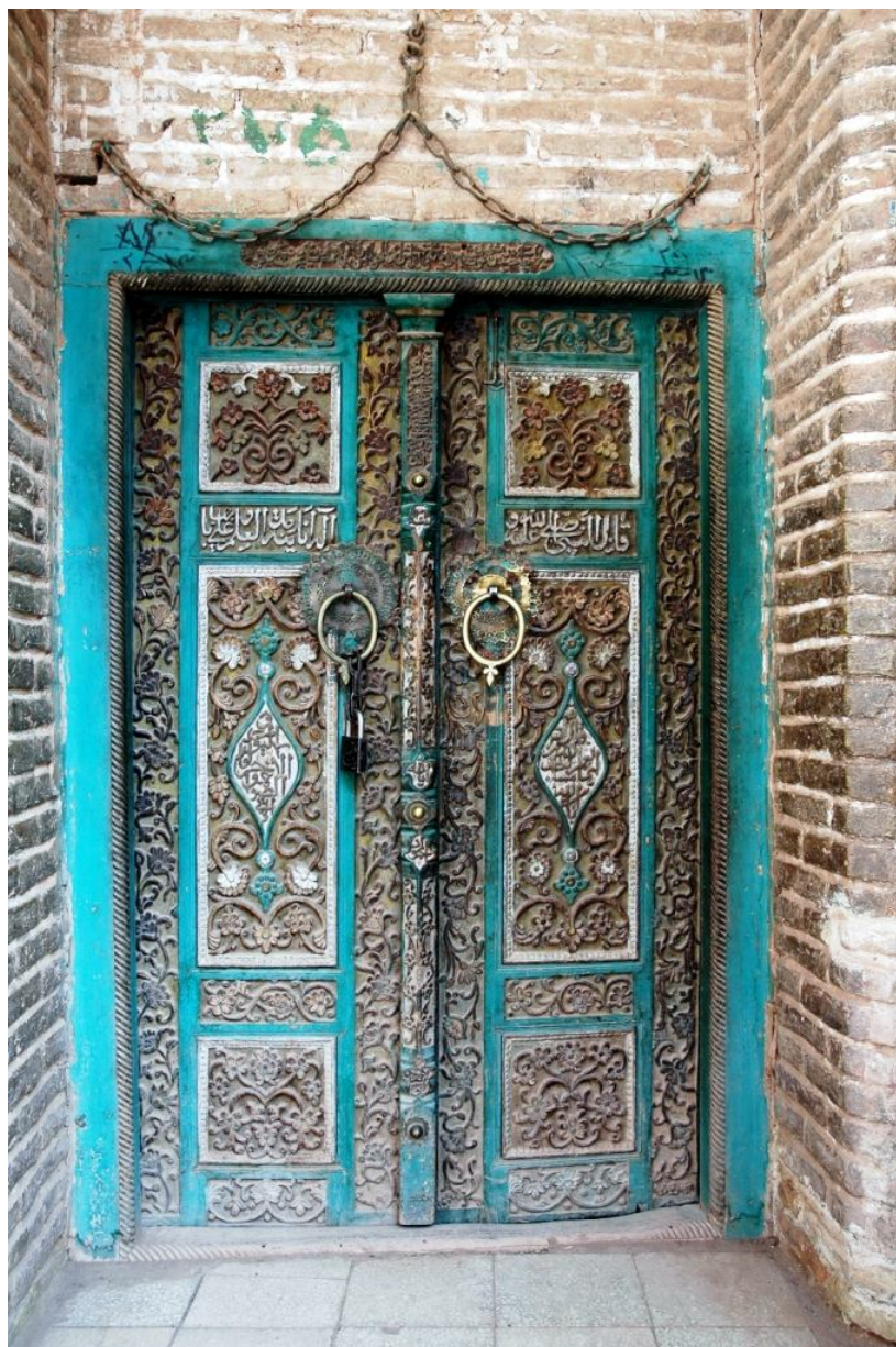
نگاره 4: در مسجد جامع

پایینی نیز نام سازنده و بانی در همراه با تاریخ ساخت آمده که به شدت آسیب دیده است. در قاب لنگه سمت راست، نام سازنده و تاریخ ساخت آمده است: «عمل استاد محمد سلطان فی تاریخ سنة 971». (ر.ک: نگاره 5)