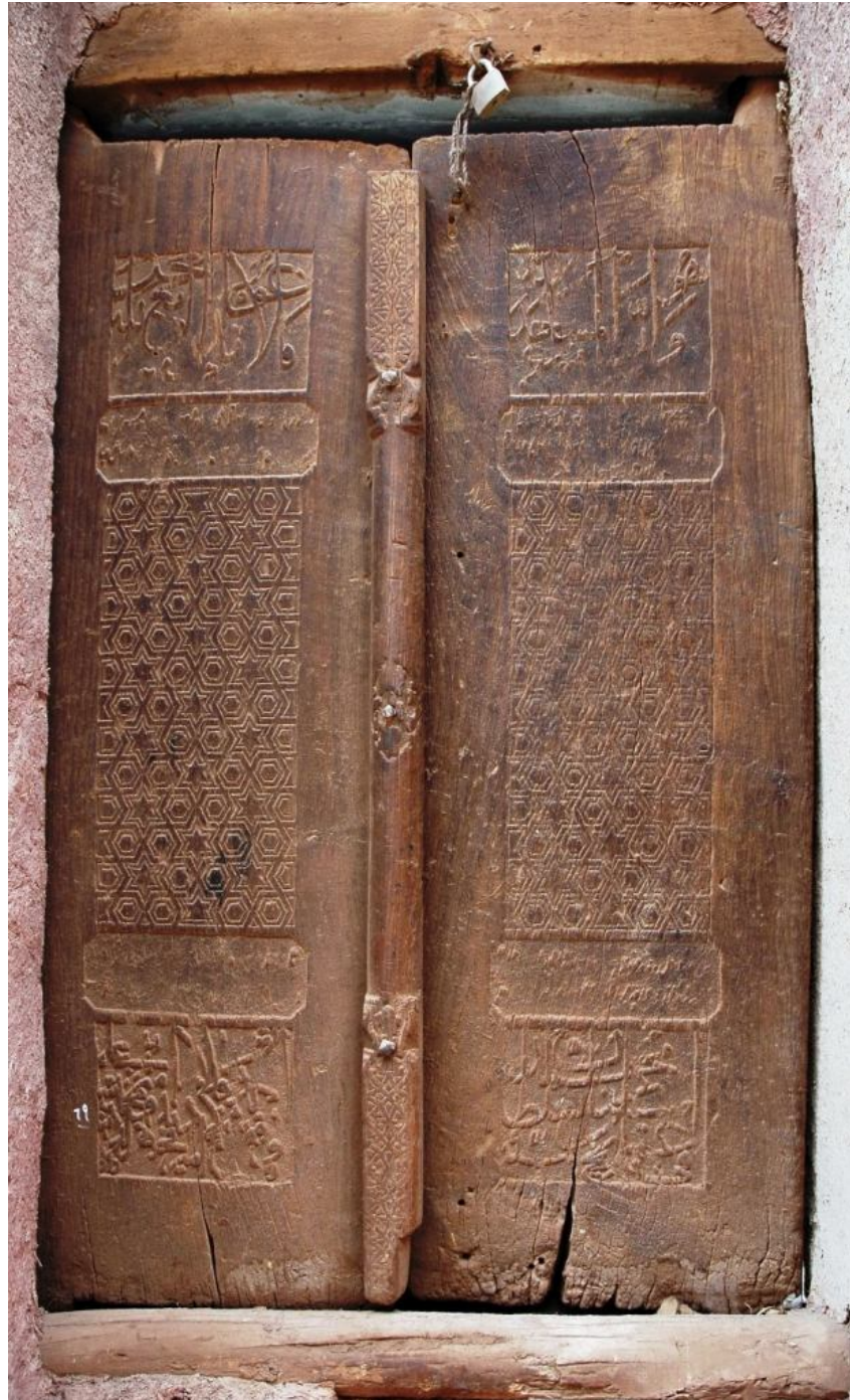
نگاره 5: در حسینیه زیارت