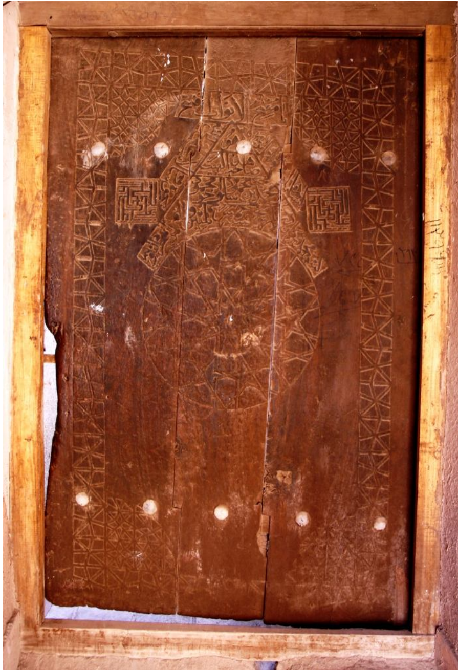
نگاره 10: در خانه جلیلی (1035 ق)

پژوهش نامه کاشان شماره سوم (پایه 11) پاییز و زمستان 1392