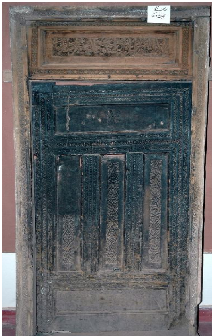
نگاره 1: در قدیمی مسجد پرزله (701 ق)

دیگر: «حاضر الوقت اسماعیل بک ابن عبدالباقی» و در دو قاب مستطیل پایین در ابتدای کتیبه، تاریخ «فی تاریخ رجب المرجب سنه ثمان و خمسين و الف» و در لنگه دیگر، نام کاتب این خطوط زیبا آمده است: «کتبه العبد حسین ابن محمد امین ابیانه» 2 (ر.ک: نگاره 2)