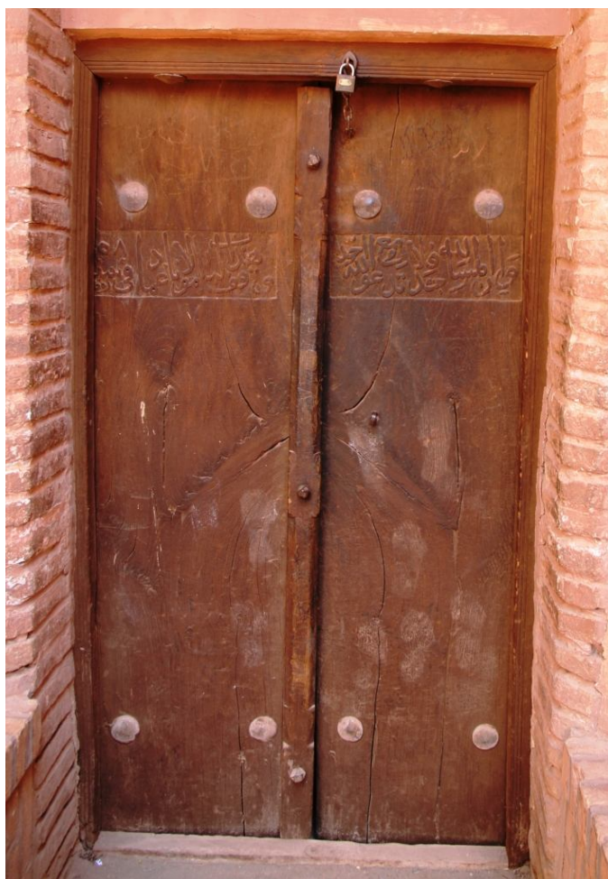
نگاره 3: در شرقی مسجد پرزله

این در دولنگه‌ای بسیار ساده بدون تزیینات و تنها دارای یک کتیبه است که در پیشانی دو لنگه در امتداد دارد که در آن، با خط ثلث آیه‌ای از قرآن در موضوع مسجد، در لنگه اول و نام واقف و تاریخ ساخت در لنگه دوم آمده است: «وَأَنَّ الْمَسَاجِدَ لِلَّهِ فَلَا تَدْعُوا مَعَ اللَّهِ أَحَدًا» (جن: 18) وقف هذا الباب مولانا عماد فی سنة رمضان 1058» (نگاره 3)