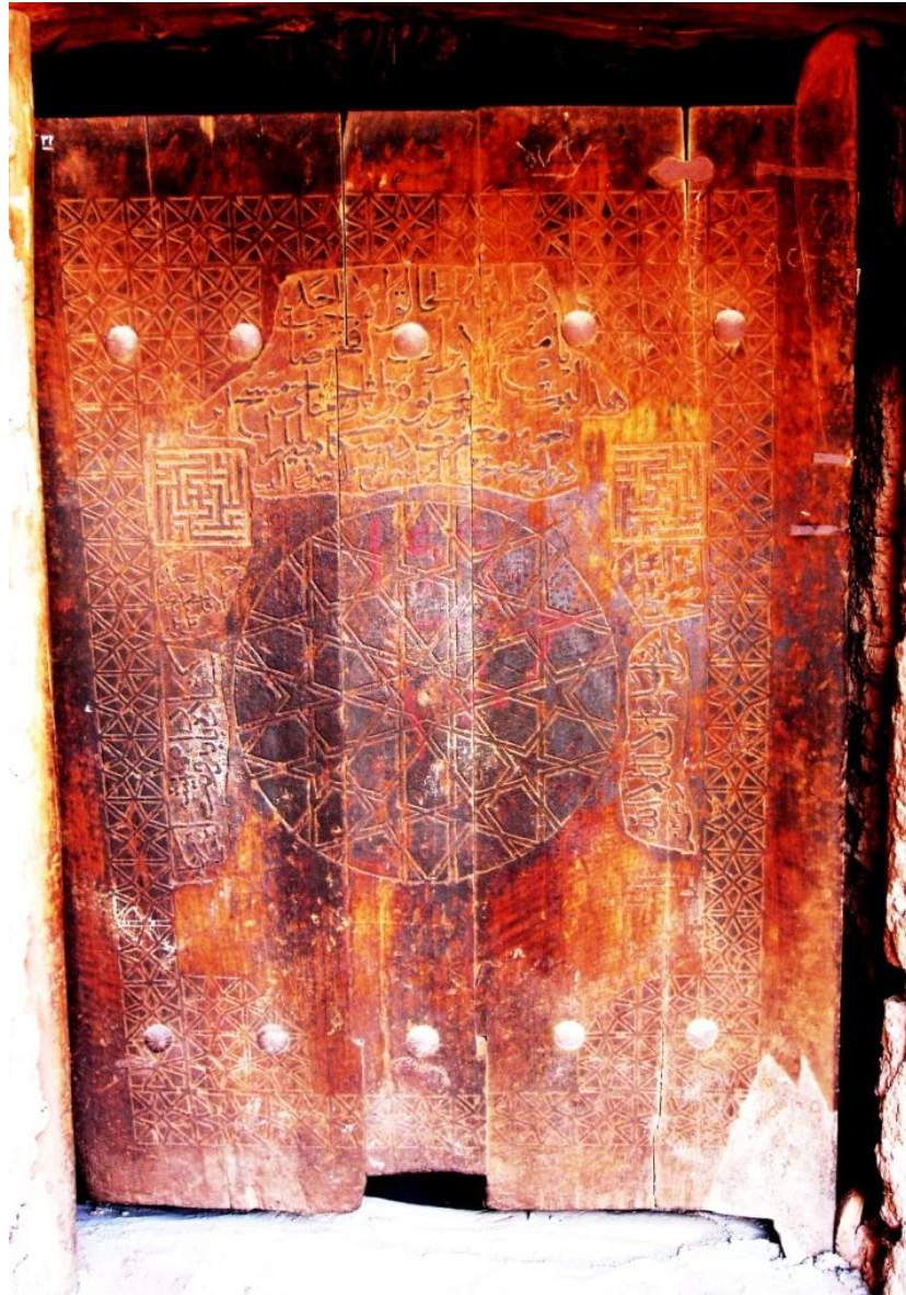
نگاره 11: در خانه امینی (مسیح 1044 ق)