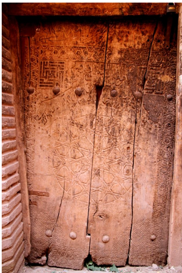
نگاره 12: در خانه خانی‌زاده (سده یازدهم)

پژوهش‌نامه کاشان شماره سوم (پایه 11) پاییز و زمستان 1392