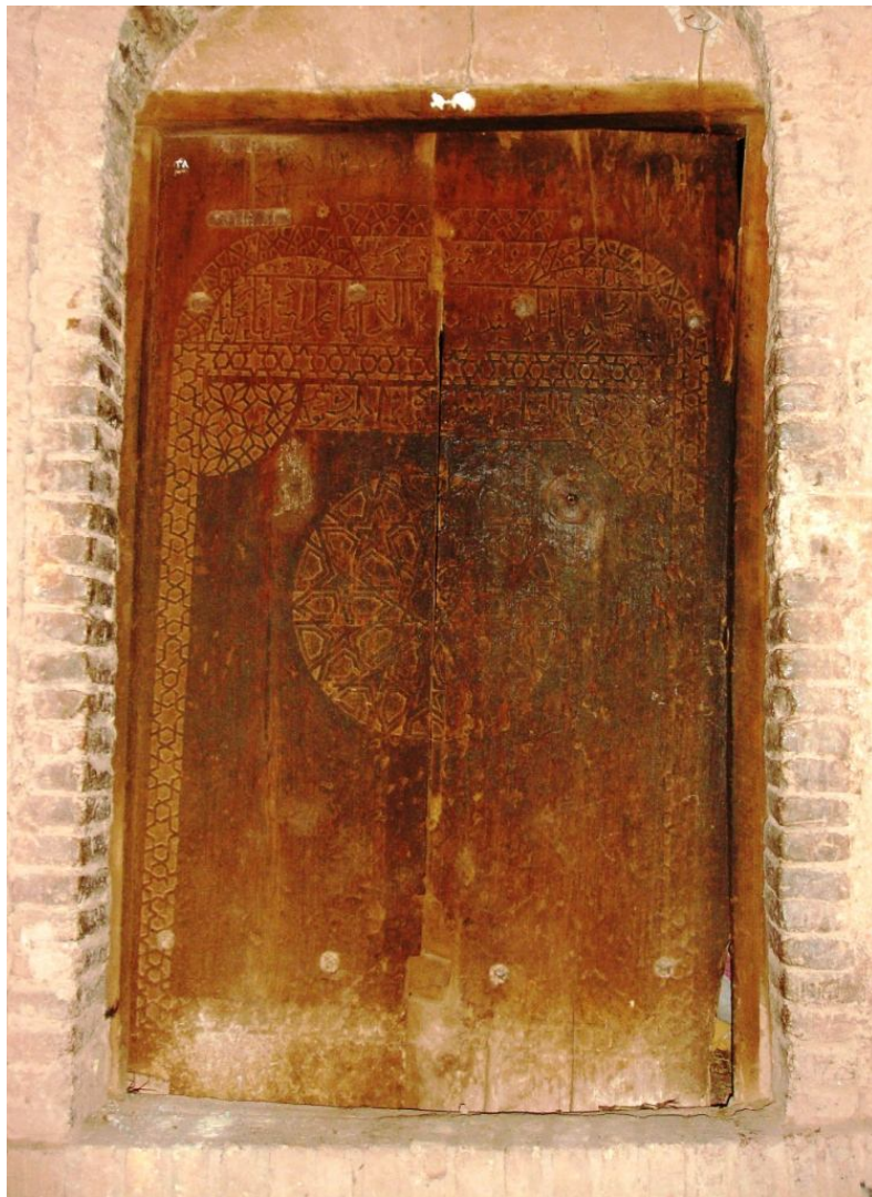
نگاره 9: در خانه مهدی اشرف

این در یک‌لنگه‌ای در اندازه 105 در 160 سانتی‌متر است و منبت‌کاری و نوشته‌هایش در حال محو شدن است. عبارت «یا الله، یا محمد و یا علی» و بیت «گشاده باد به دولت همیشه این درگاه // به حق اشهد ان لا اله الا الله» و نام مالک این در و خانه: «لصاحبه هذا الباب مولانا... ملک... محمد و میرزا محمد بن محمد در تاریخ رمضان المبارک... ثمانین و سبعمائه» (نهد و هشتاد و...) نوشته شده است. (نگاره 9)