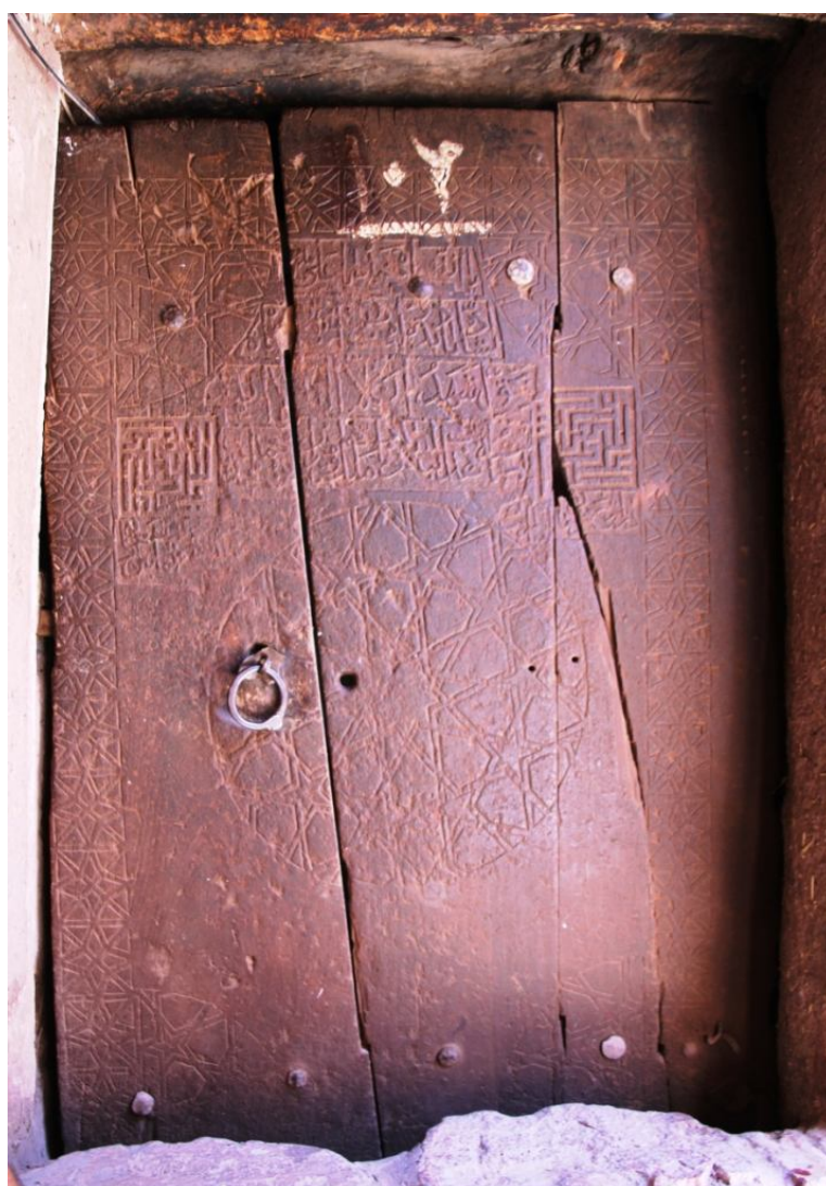
نگاره 8: در خانه ربیعی نیا (980 ق)

کتیبه‌های در کمی با دیگر درها- به جز درب خانه اشرف- متفاوت است. در سطر اول به نام صاحب در اشاره شده است: «صاحبہ خواجہ مُلکِ کَرَمِ محمد.» در پایین آن، تاریخ ساخت: «در تاریخ عشرين شوال اربع ثلاثين و تسعمائة» (934) و در جانبین آن، قطعه‌ای شعر که همان شعر موجود بر در خانه اشرف است: (نگاره 8) دری که خالق جبار بر تو بگشاید کس دگر نتواند در از تو در بستن