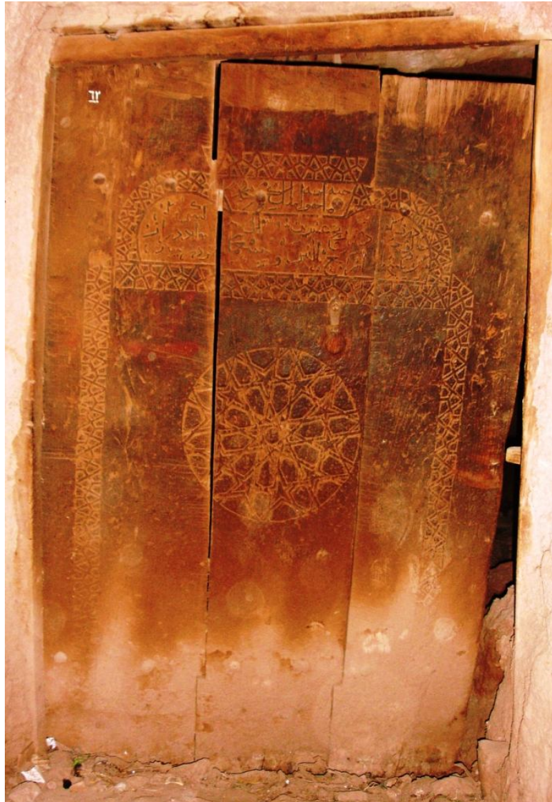
نگاره 7: در خانه مصطفایی‌ها (934 ق)