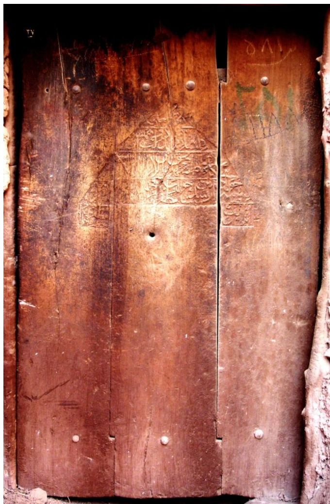
نگاره 18: در خواجه مظفر (سده دوازدهم)

قسمتی از کتیبه نیز محو شده و قابل رؤیت نیست. (نگاره 18)