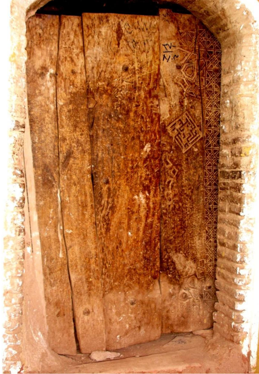
نگاره 22: در خانه حسین رضا میرزا

پژوهش نامه کاشان شماره سوم (پایه 11) پاییز و زمستان 1392