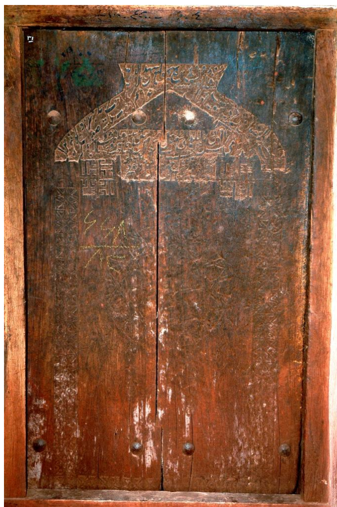
نگاره 15: در خانه خلیلی (سده یازدهم)

فارسی نوشته شده که برخی کلمات آن معلوم است. در پایان نیز نام صاحب در و کتیبه تاریخ آمده که بخش‌های زیادی از آن محو شده است. با این اوصاف به نظر می‌رسد این در از سده یازده هجری باشد. (نگاره 15)