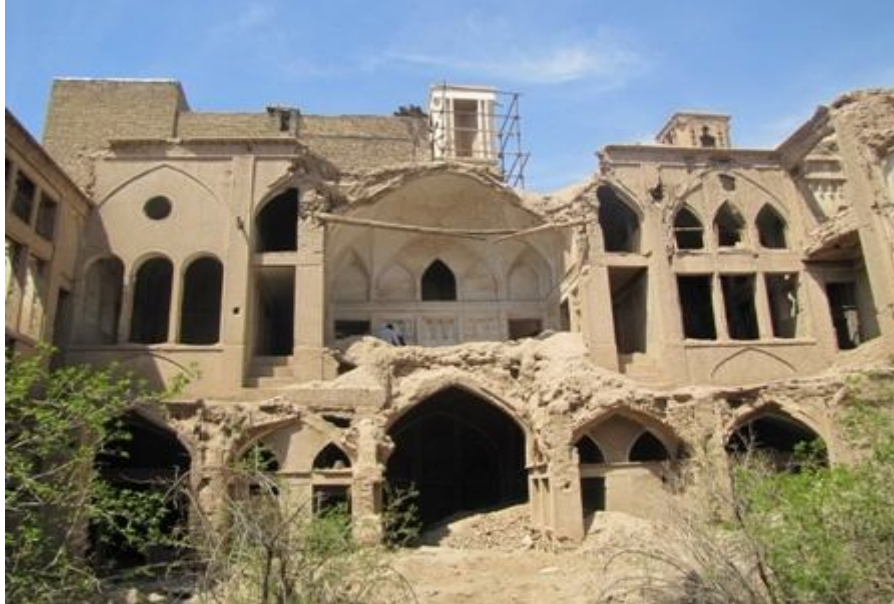
منزل مخروبه در محله یهودیان در منطقه درب گلدان کاشان