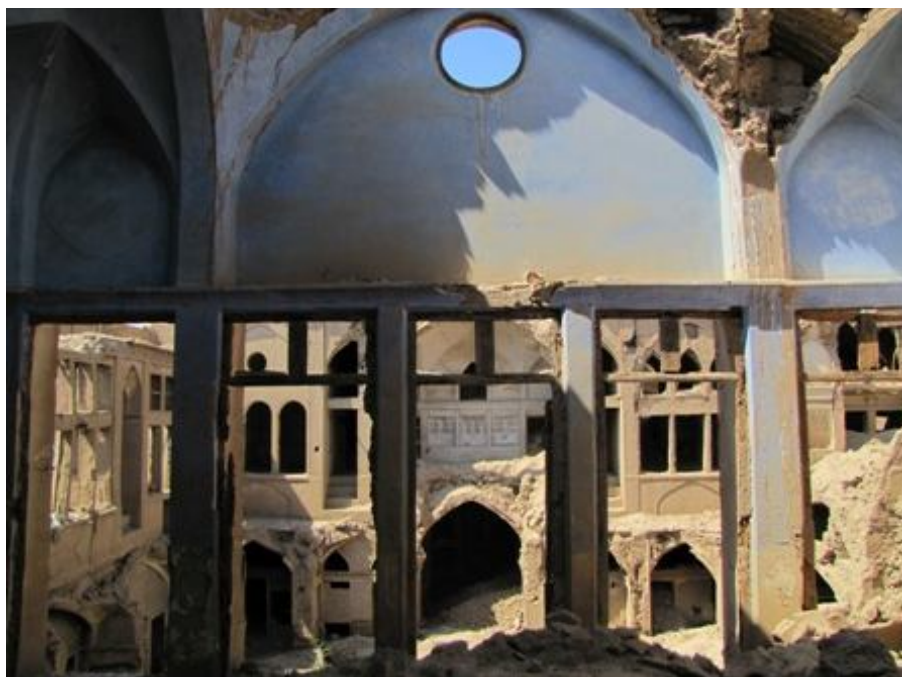
وضعیت جامعه یهودیان کاشان در دوران پهلوی و ماجرای قتل دکتر برجیس