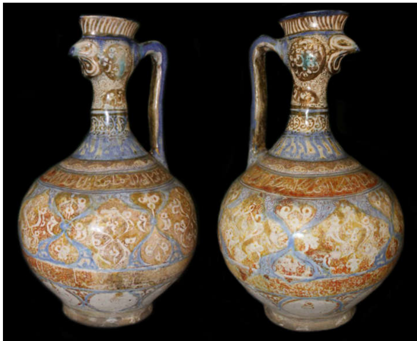
تصویر ۱: تنگ زرین‌فام، تاریخ پیشنهادی موزه: سده‌های هشتم و نهم هجری قمری، مرکز ساخت: گرگان. کاخ موزهٔ نیاوران (نگارندگان)

دیواره‌های عمودی، بطری‌ها، آبخوری‌های دسته‌دار کروی و... ساخته می‌شدند. لیکن نکته‌ای که دربارهٔ این ظرف می‌توان اشاره کرد، فرم خاص آن است. به اعتقاد واتسون، یکی از اشکال بی‌نظیر سبک درشت‌نقش، ابریق‌های (صراحی) به شکل حیوانات (کله خروس) است، که منبع بسیاری از این شکل‌ها آثار فلزی است (همان: ۸۴). علاوه بر فرم، واتسون معتقد است کتیبه‌های تزئینی اندکی در سبک درشت‌نقش به کار رفته است؛ کتیبه‌های این سبک اغلب سرهم ناخوانا و معمولاً بر مبنای یک رشته دعا‌های موسوم برای صاحب اثر است که در بیشتر موارد دورتادور سطح بیرونی ظروف امتداد یافته (همان: ۵۷) که ویژگی اخیر نیز در این ابریق دیده می‌شود. بر این اساس، با توجه با تاریخ‌گذاری و مکان ساخت ارائه‌شده از سوی واتسون برای آثار سبک درشت‌نقش، می‌توان گفت تنگ زرین‌فام مورد مطالعه حدوداً در اواخر قرن ششم هجری قمری و در کاشان تولید شده است. همچنین با در نظر گرفتن موارد مشابهت این اثر با نمونه‌های تطبیقی شناسنامه‌دار در موزه‌های مختلف که در جدول (۱) نشان داده شده، این شیء احتمالاً متعلق به کاشان لیکن اواخر قرن ششم و اوایل قرن هفتم هجری قمری است.