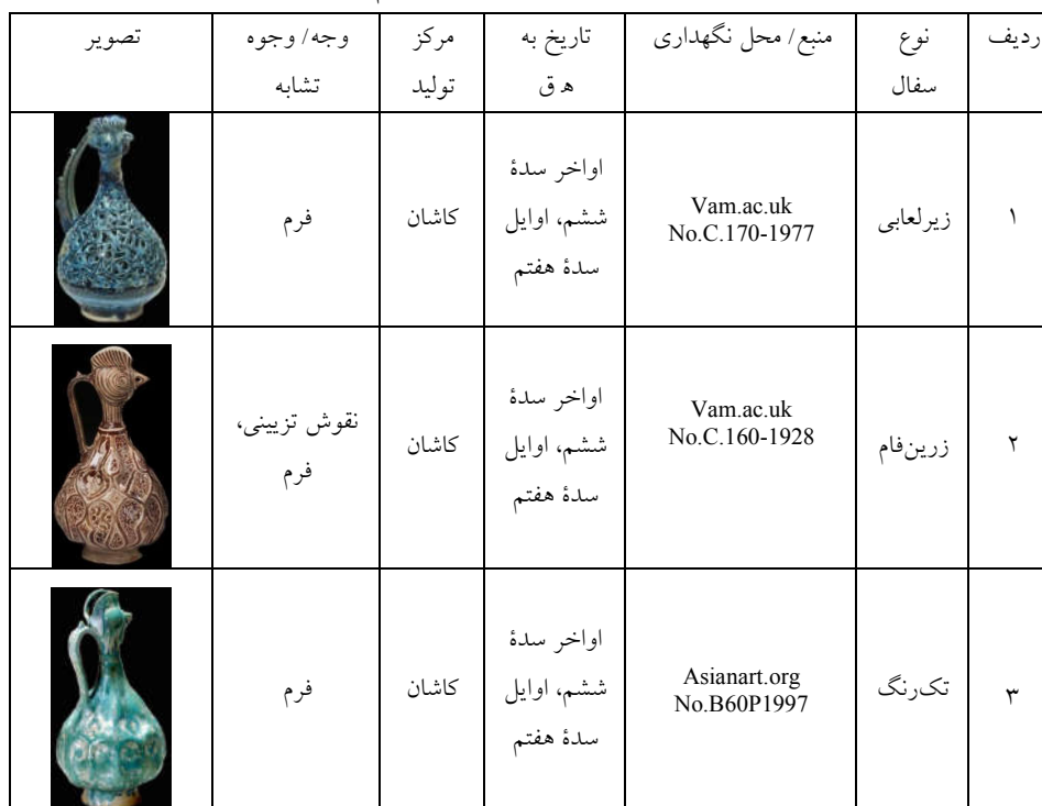
جدول ۱: نمونه‌های مشابه در سایر موزه‌ها از نظر فرم با نمونه مطالعاتی