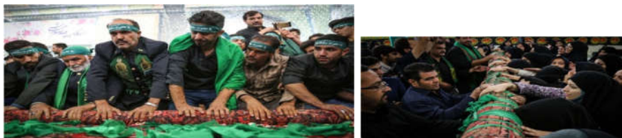
تصویر ۳ الف و ب: عاملیت فیزیکی قالی؛ تبرک جستن و طلب حاجات (URL2)

می‌رسد در مناسک قالی‌شوینان مشهد اردهال، قالی به‌عنوان شیء هنری حامل نشانه است که معنا را انتقال می‌دهد و عاملیت دارد. از منظر انسان‌شناسی هنر میان دو بُعد معناشناختی و زیباشناختی قالی (شیء هنری) برای حاضرین در مراسم، وجه کارکردی منظور نظر است. بنا بر نظریهٔ جل قالی در بستر اجتماعی-ارتباطی مراسم قرار گرفته، تولید معنا می‌کند؛ قالی به‌مثابهٔ پیکر مطهر امامزاده سلطان‌علی یا تابوت ایشان بر روی دست و دوش مردم به حرکت درمی‌آید. بسیاری برای شفایابی و طلب حاجات نوارهای سبزرنگ را متبرک می‌کنند (تصویر ۳ الف و ب). قالی در واقع نمادی است که بار معنایی مناسک را بر دوش می‌کشد. «وقتی نماد آنقدر اهمیت می‌یابد که در بین اشکال مجموعه جایی برایش در نظر گرفته شود، می‌تواند کل اشکال داخل صحنه را تحت پوشش کامل قرار دهد» (بوآس، ۱۳۹۱: ۱۴۴) پس از پایان مراسم، قالی به تولید بقعه متبرکه تحویل می‌گردد تا به‌عنوان نمادی آیینی حفظ و نگاهداری شود.