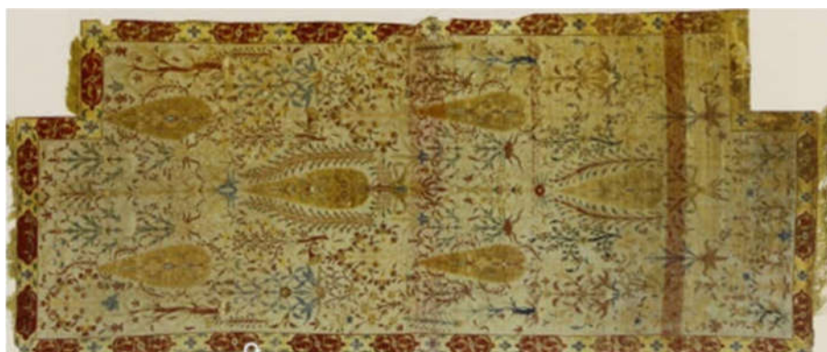
تصویر ۲: قالی مقبره شاه عباس دوم در موزه آستان حضرت معصومه (س)، اثر استاد نعمت الله جوشقانی، ابعاد

۸۵ در ۱۱۸ سانتی متر (پوپ و آکرمن، ۱۳۸۷: ج ۱۲، ۱۲۵۸)