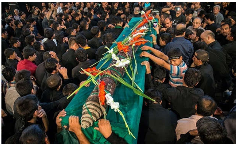
تصویر ۴: بُعد حسی و عاطفی قالی به‌مثابه اثر هنری. مردم به‌عنوان تابوت و پیکر مطهر امامزاده قالی را زیارت می‌کنند (URL3).

حسی به‌عنوان اثر هنری تبیین می‌شود (تصویر ۳).