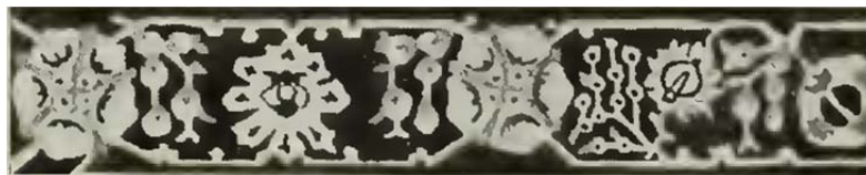
شکل ۱۱: حاشیه گل‌دار رایج در فرش‌های کاشان و ساروق براساس تحلیل بصری هاوولی (Hawley, 1913: Plate E)

بر پایه نوع قوس محراب می‌توان محل بافت فرش‌ها را تشخیص داد (Ibid: 62). از دیگر سو براساس نقوش حاشیه نیز می‌توان خاستگاه فرش را تشخیص داد (شکل ۱۰ و ۱۱). بر همین اساس، نقوش فرش کاشان را متفاوت از فرش‌های عشایری می‌داند که در آن نقوش به هم پیوسته‌اند [چندتراز]، نه مجرد و مستقل [تک‌تراز] ۴۹ (Ibid: 134). در همین راستا اگر زمینه فرش دارای تریج‌های متحدالمرکز باشد، فرش ممکن است کرمانشاه، ساروق، کاشان، سنه، گروان، هریس، تبریز، محل، مشک‌آباد یا سلطان‌آباد باشد (Ibid: 286). قاعدتاً برخی از آنچه هاوولی درباره متغیرهای شناختی فرش کاشان ذکر کرده قابل بحث است؛ اما آنچه اهمیت دارد، تعیین حدود برای شناسه‌ها و موشکافی آن‌هاست که نشان می‌دهد تا چه اندازه بر دانش فرش‌شناسان بر جغرافیای بافت کاشان افزوده شده بوده است.