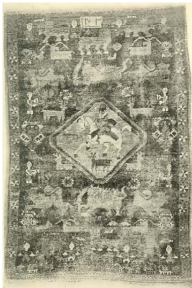
شکل ۴: گبه لری فارس که ریپلی به اشتباه آن را فرش ابریشمی کاشان دانسته است

فرش‌شناس و مجموعه‌دار سوئدی، کتاب تاریخ فرش‌های شرقی پیش از ۱۸۰۰م را منتشر کرد. شیوه مارتین در تاریخ‌گذاری و گمانه‌زنی درباره محل بافت فرش‌های ایرانی همانند سنت جامعه دانشگاهی آن دوران و فرش‌شناسانی چون فون‌بده و زاره، محافظه‌کارانه و کل‌نگر است. او جغرافیای فرش ایران را به غرب، شمال غرب، شرق، جنوب، جنوب غرب و وسط دسته‌بندی کرده و جزئیات بیشتری نیفزوده است.