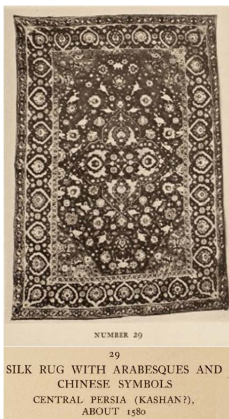
29 SILK RUG WITH ARABESQUES AND CHINESE SYMBOLS CENTRAL PERSIA (KASHAN?), ABOUT 1580

در همین سال (۱۹۱۰)، موزه متروپولیتن نیویورک نیز نخستین نمایشگاه تخصصی هنر اسلامی را در آمریکا ویژه فرش‌های شرقی برگزار کرد. گردآورنده و نویسنده کاتالوگ آن والتینر، شاگرد و همکار فون‌بده در برلین بود. والتینر گرچه رساله‌اش را با راهنمایی فون‌بده نوشت و از پیروان مکتب برلین بود، جسارتش در گمانه‌زنی محل بافت فرش‌ها آشکارا آمیزه‌ای از شیوه فرش‌پژوهان