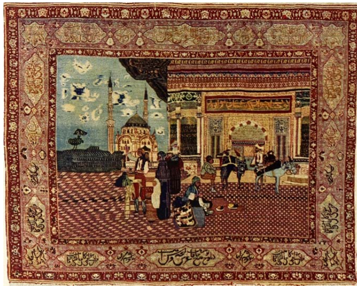
شکل ۱۲: فرش تصویری کاشان، مجموعه سی. میر مولر (Pünter, 1917: No. 8109)

در ۱۹۱۷، آرتور پوپ و همکاران کاتالوگی برای نمایشگاه مجموعه آثار هنری فیبی هیرست ۵۰ آماده کردند که در کاخ هنرهای زیبای سان‌فرانسیسکو برگزار شده بود. نگارش بخش فرش‌های شرقی مجموعه را خود پوپ بر عهده داشت. این کاتالوگ نخستین پژوهش جدی پوپ در زمینه فرش‌های شرقی و ایرانی است. او نخست به مقایسه فرش‌های عتیقه صفوی با نمونه‌های نوباف قاجاری می‌پردازد. به باور او، فرش‌های نوباف گرچه ظریف و مجلل هستند، روح ندارند: «کاشان‌ها، ساروق‌ها و کم‌ویش کرمان‌ها [ی نوباف] از نظر ظاهری غنی و فاخر هستند؛ اما روح آن‌ها از بین رفته است و برای کسانی که به فرش‌های عتیقه خو کرده‌اند، به طرز ناامیدکننده‌ای مصنوعی به نظر می‌رسند [...] و ظرافت آن‌ها گاهی کسل‌کننده است» (Pope, 1917: 76). همچنین پوپ درباره فرش‌های کاشان دوره شاه‌عباس، ادعایی بدون ارائه مستندات و پشتوانه علمی طرح می‌کند: «شاه‌عباس با استعدادترین طراحان ایرانی را به ایتالیا فرستاد و در آنجا نزد رافائل شاگردی کردند و رازهای رنسانس را فراگرفتند [...] بسیاری از فرش‌های ایران، عملاً همه کاشان‌ها، ساروق‌ها و کرمانشاهان، بر ایند این آموزش اروپایی بوده‌اند (Ibid: 101). به‌هرروی این ادعا نادرست و طرح آن از سوی پوپ نامنتظره است. رافائل در ۱۵۲۰ درگذشته (URL2) و شاه‌عباس زاده ۱۵۷۱ (URL3) است. درضمن، شهرت فرش‌های ساروق بسیار متأخرتر از دوره صفوی است. پوپ بعدها (۱۹۳۸) در کتاب سیری در هنر ایران ، دیگر این ادعا را پیش نمی‌کشد.