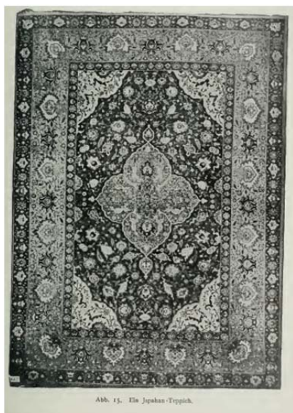
شکل ۵: فرش لچک‌ترنج ابریشمی کاشان، نیمه دوم سده دهم ق، موزه گوبلن/موبیلیه ناسیونال. نوبگار و اورندی این فرش را بافت اصفهان پوپ کاشان دانسته‌اند

کتابچه راهنمای فرش شرقی نوشته دو مجموعه‌دار به نام‌های فون رودولف نوبگار و ژولیوس اورندی، ۴۰ ۱۹۰۹ در لایپزیک منتشر شده است. این کتاب از نظر علمی هم‌تراز آثار فرش‌شناسان آلمانی (فون‌بده و زاره) نیست و روش و رویکرد آن، به فرش‌پژوهان آمریکایی چون مامفورد و ریپلی شبیه‌تر است. آن دو برای گردآوری فرش و اطلاعات به جنوب غرب آسیا سفر و یک دسته‌بندی کلی از فرش‌های شرقی بر پایه کشور تولیدکننده ارائه کردند که دربرگیرنده فرش‌های آنتولی، قفقاز، ایران و کشورهای آسیای میانه است. نوبگار و اورندی بر این باورند که هرگونه دسته‌بندی طرح و نقش فرش‌های شرقی بسیار دشوار و شاید غیرممکن باشد؛ زیرا اقوام آسیایی بسیار درهم‌آمیخته‌اند و به این دلیل هنرشان نیز آمیزه‌ای از فرهنگ‌های گوناگون و خرده‌فرهنگ‌هاست (Neugebauer & Orendi, 1909: 91). آنان فرش‌های ایرانی را از نظر طرح، نقش، کیفیات بافت و نوع مواد اولیه به شش دسته تقسیم کرده‌اند که عبارت است از: آذربایجان، فراهان، کردستان، خراسان، کرمان و قشقایی. نویسندگان توضیح چندانی درباره هر دسته نمی‌دهند و به شرحی کلی در حد دو بند بسنده کرده‌اند. ازسویی به زیرمجموعه‌های هر دسته چون کاشان نیز اشاره‌ای نمی‌کنند. گنجاندن گروهی عشایری (قشقایی) برای نخستین بار به دست نوبگار و