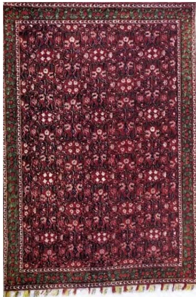
شکل ۲: فرش سنه، دوره قاجار که مامفورد به اشتباه آن را به کاشان منتسب کرده است (Mumford, 1901: Plate VI).

مرسوم نیست و بازرگانان ایرانی نام‌های دیگری به کار می‌برند» (Ibid: 98). در این دسته‌بندی نامی از کاشان نیست و شاید یکی از زیرگروه‌های اصفهان، ساروق، جوشقان حتی تهران در نظر گرفته شده باشد. در متن کتاب نیز کمتر اشاره‌ای به کاشان به‌عنوان حوزه فرش‌بافی شده است و احتمالاً مامفورد در سفرش به ایران، کاشان را ندیده باشد؛ باین‌همه دو بار از کاشان نام می‌برد. نخست در وصف فرش ابریشمی از مجموعه مارکاند ۲۸ به این نکته می‌پردازد که این فرش از نظر فنون بافت، طرح، نقش و رنگ‌بندی متفاوت با نمونه‌های صفوی بافته‌شده در اصفهان است؛ پس متأخرتر و احتمالاً بافت فراهان، سنه، کاشان یا رشت باشد (Ibid: Plate VI) (شکل ۲). مامفورد آشکارا در تعیین جغرافیای بافت فرش مردد است؛ از این‌رو جغرافیای بافتی وسیع و ناهمگون را گمانه‌زنی کرده است. او در شرح این تردید می‌نویسد: «دسته‌بندی و تعیین محل بافت فرش‌های ایرانی به سبب تغییراتی مستمر که در طرح آن‌ها وجود دارد بسیار دشوار است؛ از جمله این تغییرات، جابه‌جایی صنعتگران فرش از شهری به شهر دیگر است [...] آن‌ها] در این انتقالات روش‌ها و طرح‌هایشان را نیز با خود می‌برند» (Ibid). گفتنی است چله ابریشمی متداول در سنندج که در شکل ۲ پیداست، همچنین طرح واگیره و حاشیه فرش که به گروه گل‌فرنگ‌های سنه تعلق دارد، وابستگی این فرش به سنه را قوی‌تر می‌کند.