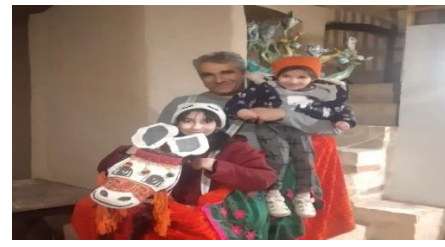
شکل ۲: مجموعه ای از فعالیت های اقامتگاه بوم گردی و موزه عروسک و اسباب بازی کاشان